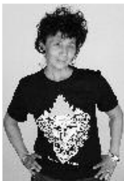
15 € christian lacroix