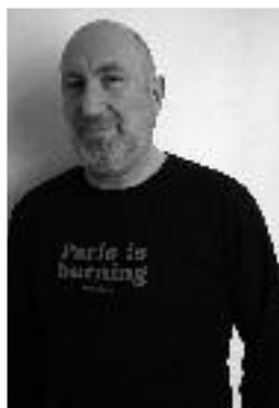
20 € agnès b