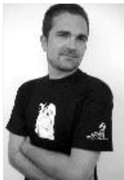
15 € louise attaque