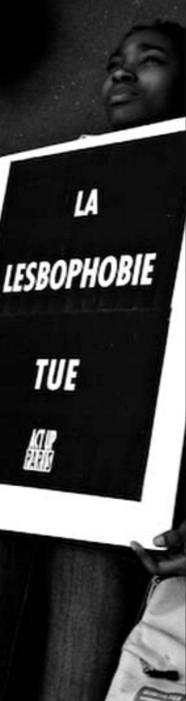
17 mai Paris - Journée mondiale contre l'homophobie