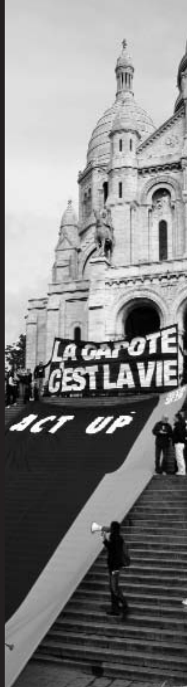
13 septembre Paris - Le pape en France Pas de tapis rouge pour Benoit XVI