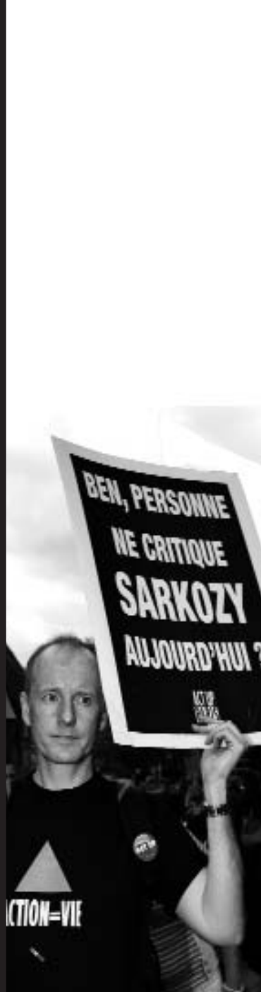
28 juin Paris - Marche des fiertés Sortons le sida du placard