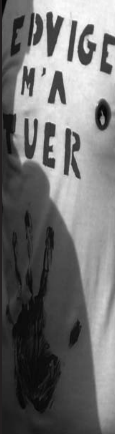
24 juillet Marseille - UEEH Manifestation contre le fichier Edvige