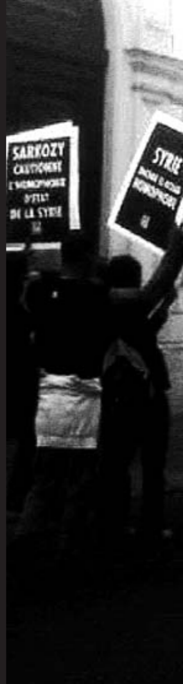
14 juillet Paris - Ambassade de Syrie LGBT persécutés, Sarkozy se tait