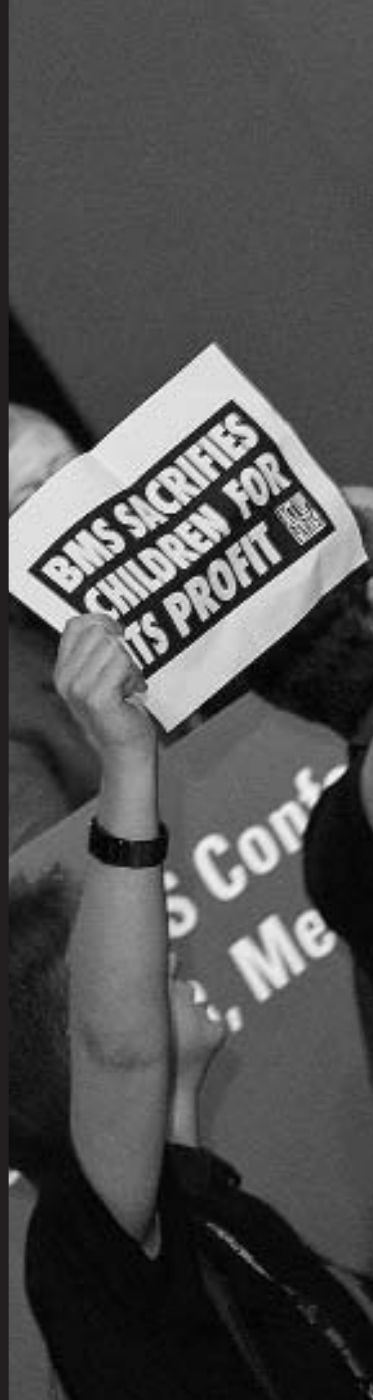
9 juin Mexico - Zap contre BMS BMS sacrifie les enfants pour son profit