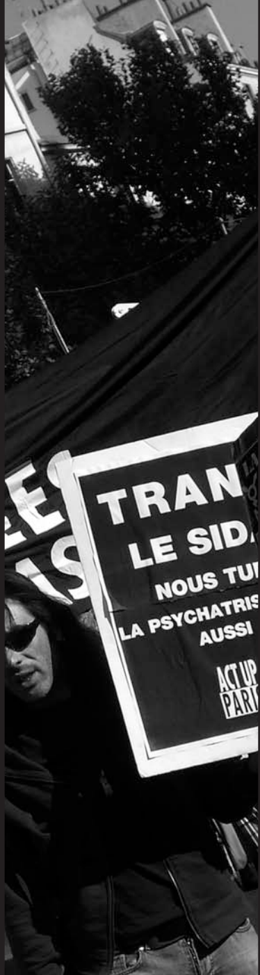
11 octobre Existrans