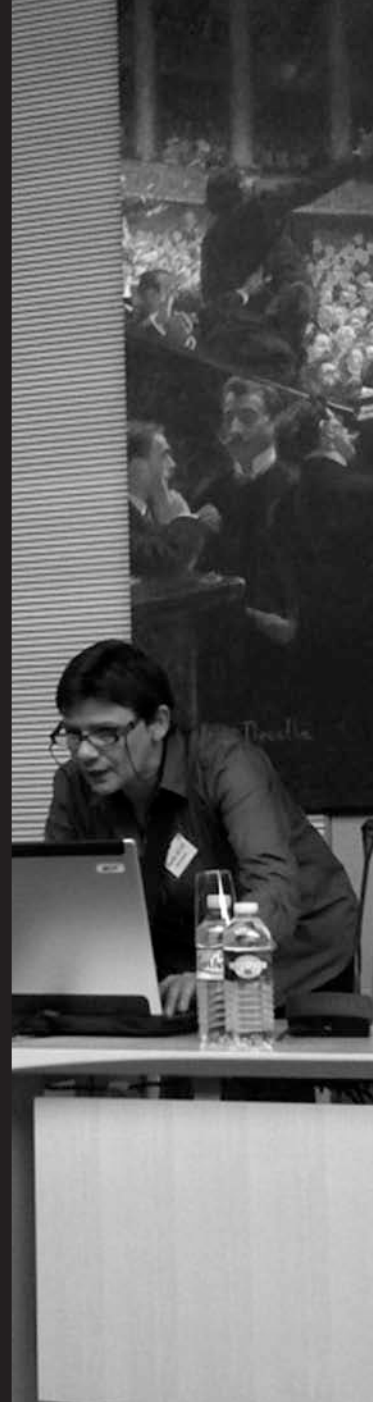
15 octobre Rencontre Femmes et VIH à l'Assemblée nationale