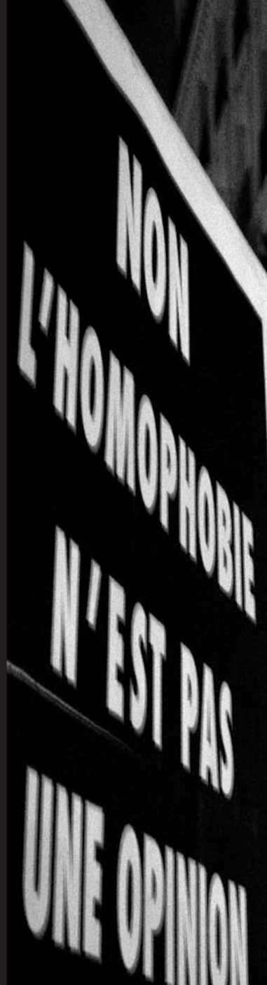
22 novembre Rassemblement contre l'arrêt de Cassation en faveur de Vanneste.