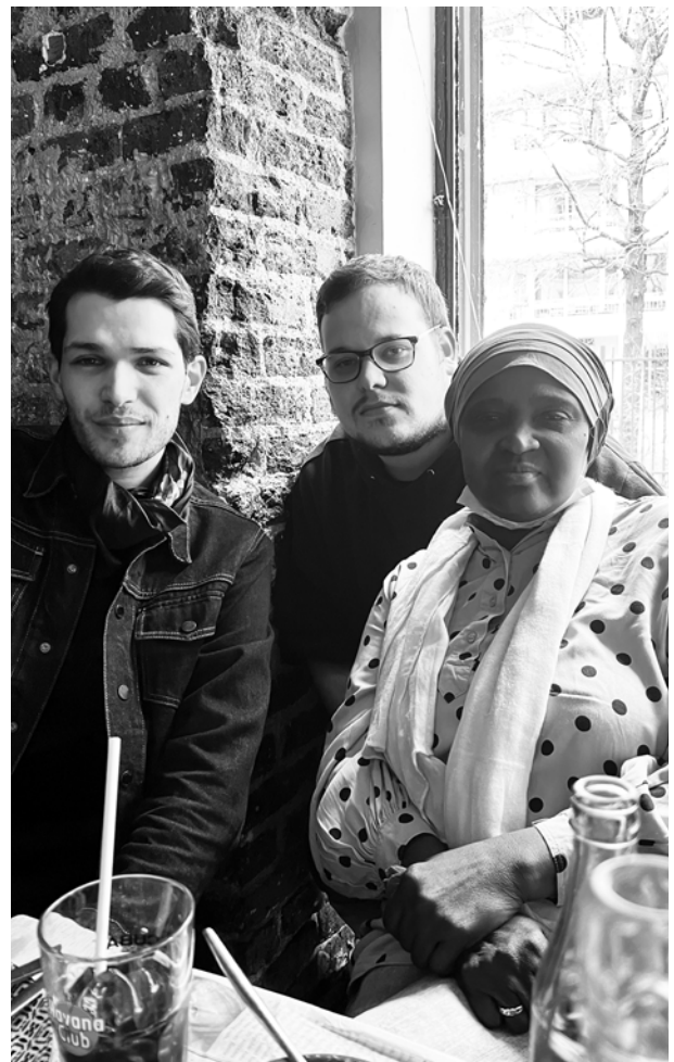
Repas de la permanence

Ces 25 ans ont donc été honorés comme nous le faisons à Act Up-Paris depuis bientôt 35 ans : en faisant ce pour quoi nous sommes bons, experts et pertinents tout en gardant la vie et la fête en tête. En luttant contre la sérophobie et pour les droits des personnes séropositives. En luttant pour nos communautés. Notre souhait à terme c'est que la Permanence ne soit plus nécessaire aux PVVIH et à nos communautés. Nous en sommes encore loin et nous continuerons le combat aussi longtemps que nécessaire toujours avec et aux côtés des personnes concernées !